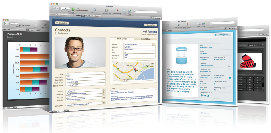
Beheer eenvoudig uw belangrijke informatie in FileMaker Pro 12. Maak verbluffende databases met thema's, grafieken, foto's, documenten en meer.